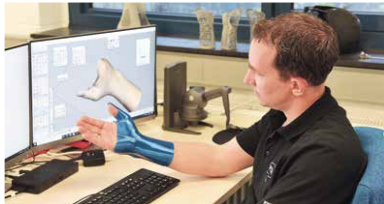
Bei der Entwicklung neuer Produkte spielen die Scantechnologie und der 3D-Druck eine wichtige Rolle.

Dieses Modell der vertrauensvollen interdisziplinären Zusammenarbeit ist nahezu einmalig und bewährt sich seit über 25 Jahren. Bei ORTEMA selbst arbeiten Orthopädie-Techniker, Physio-, Ergo- und Sporttherapeuten, Dipl. Sportwissenschaftler sowie Reha-Mediziner Hand in Hand für eine umfassende Versorgung und die Entwicklung neuer innovativer Produkte.