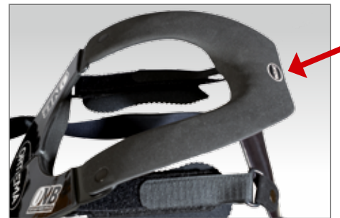
Keinerlei Bewegungseinschränkung auch im Vollschalensitz dank der abgeflachten hinteren Kante