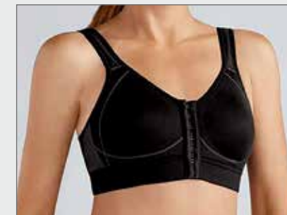
BH für die post-operative Nachsorge